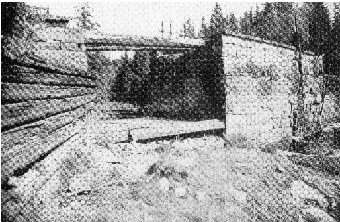
Fra demningen på Sloradammen idag , fra vannsiden

Lagets styre har nedsatt ei prosjektgruppe til å arbeide videre med saken. De som har tips e.l. som gruppa kan ha nytte av, kan kontakte lagets leder, adresse og telefon, se side 2.