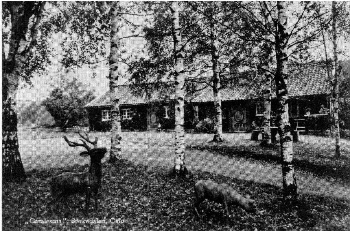
„Gamlestua”, Sørkedalen, Oslo