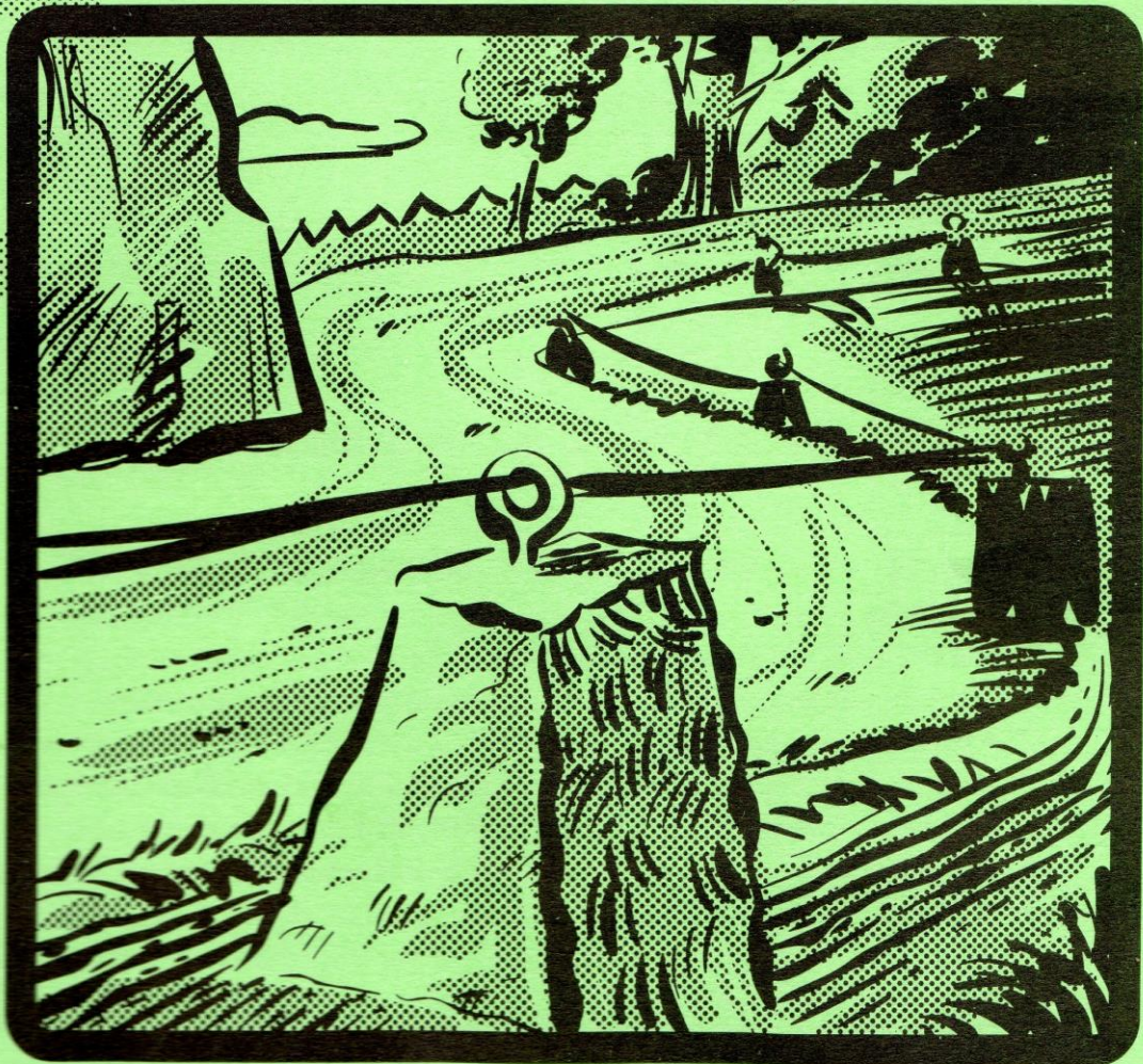
Veien til Sørkedalen...