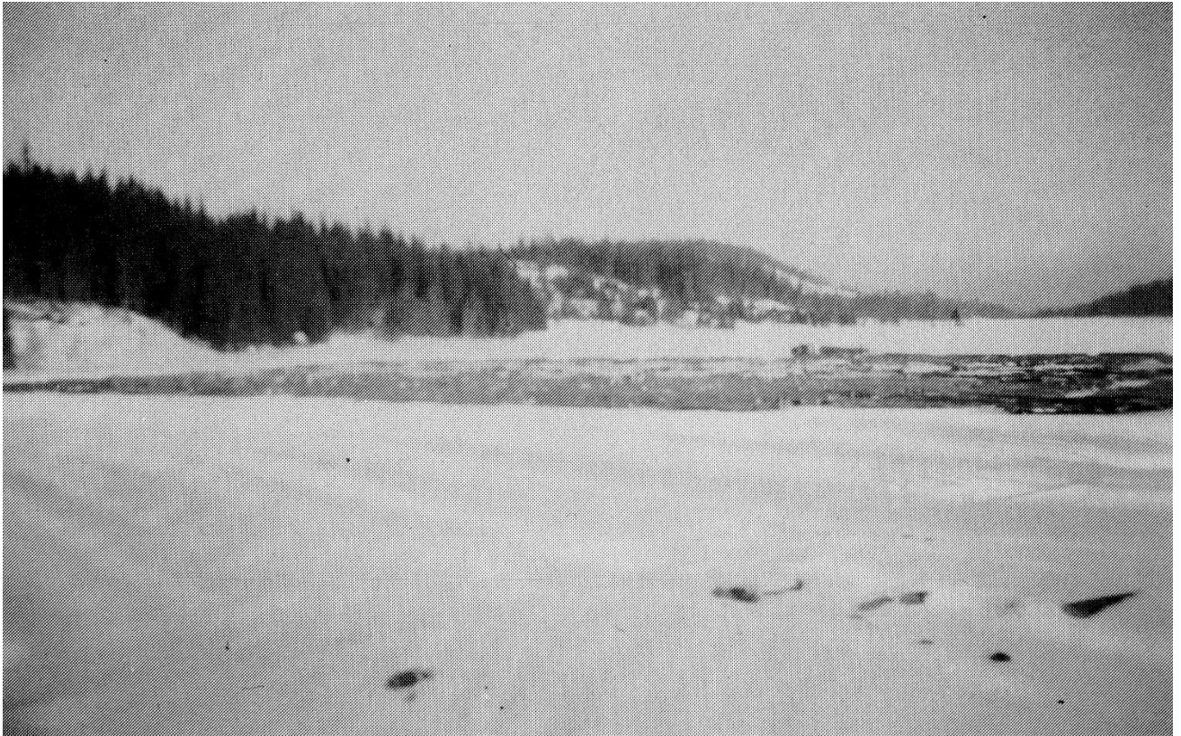
Pjåkavelta, med tømmer flaker på Vesle Flåtan mot Hauken

Fløtingen foregikk stort sett på samme måte helt fra det startet langt tilbake i tiden. Riktignok ble hjelpemidlene bedre, - varpeflåten ble avløst av påhengsmotor, vanskelige elvestrekninger ble erstattet med tømmerrenner osv.