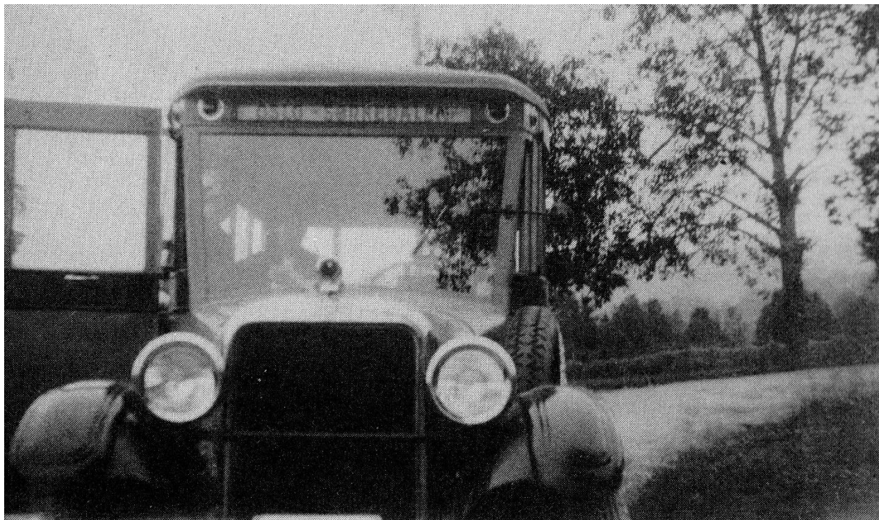
Den første bussen ? - over vinduet står det Oslo Sørkedalen.