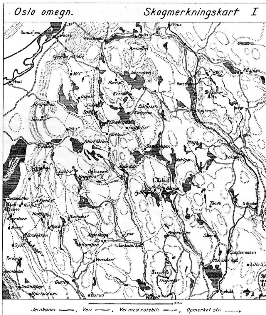
Oversiktskart - hentet fra Den norske Turistforenings årbok 1929, da det var få bilveier i Marka.

I mellomkrigstiden var det allerede stor skitrafikk til Heggeliset, der det som på så mange Markaplasser var servering den gang. Denne virksomheten er også idag i gang i helgene. Også sommerstid var det nok en del turfolk som la turen hit. Allerede i 1929 var det merkede stier fram til Heggeliset, foruten fra Aspeskogen også fra Kringla over Oppkuven.