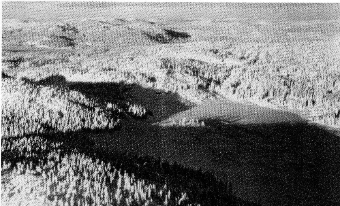
Bilde av Krokskogen med nordre Heggelivann i forgrunnen, og Heggeliseter i skyggekannten, bildet er tatt i januar 1951. I bakgrunnen ser du Flåtán