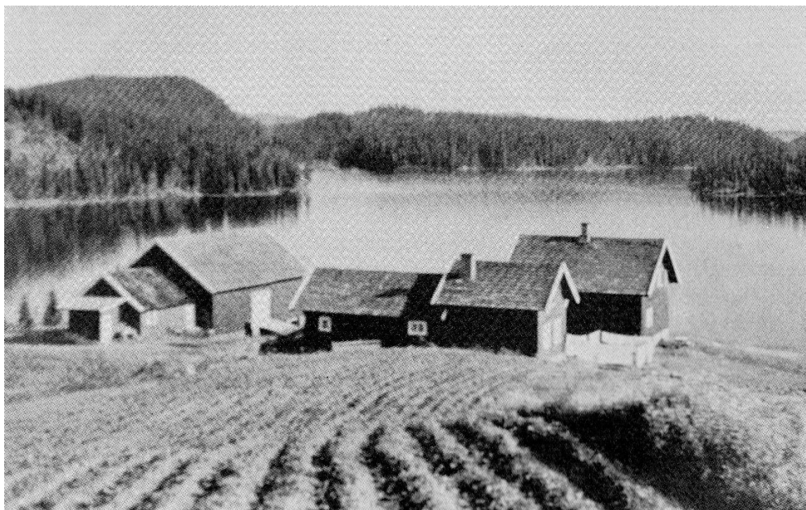
Heggelisetra ligger flott til ved Nordre Heggelivannet.

Veien vi skal kjøre på 8. juni ble påbegynt (fra Pipenhus) i 1963 og fullført i 1967. Den heter offisielt «Nye Heggelivei». Med denne veien ble Heggeliseter tilknyttet Markas moderne veinett, en vei som er lett å holde åpen også i snøvinters. I 1964 var det også fullført veibygging på vestsiden av Storflåtán fram til Damtjern.