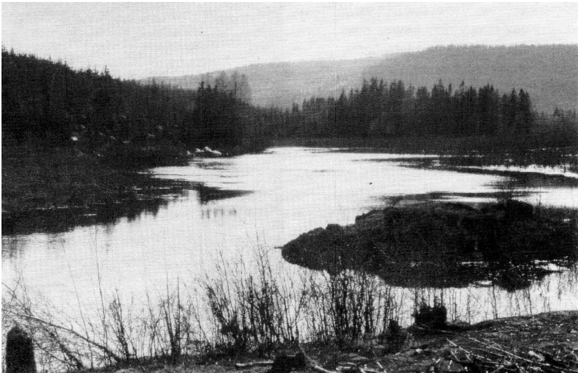
Bilde fra dammen omkring 1970, som man ser er vannet allerede noe nedtappet.

Man kan jo spørre seg om man virkelig har bruk for vann i dammen. Mange vil kanskje hevde at turismen i Sørkedalen ville øke, og at dette ville virke negativt inn på lokalsamfunnet. Jeg tror at dette derimot bare vil virke positivt inn på Sørkedalens ståsted i lokalpolitikken. For i disse dager da det snakkes om utbygging av nye boliger i Sørkedalen, og markagrensen stadig trues hva kan vel da være bedre enn å få folk ut i marka?